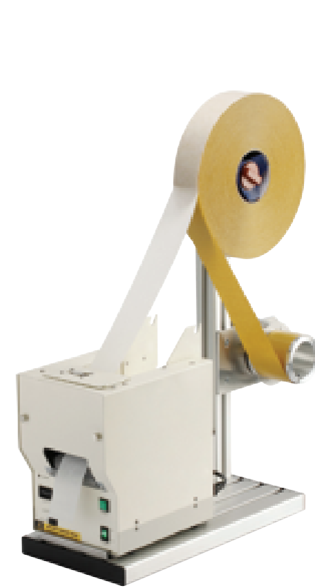
Gerätehalter mit verstellbarer Neigung 900-5708235 A