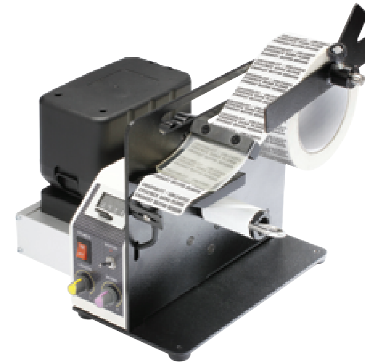
A 521.60 accu

Tiefe: 215mm, Breite: 157mm, Höhe: 215mm